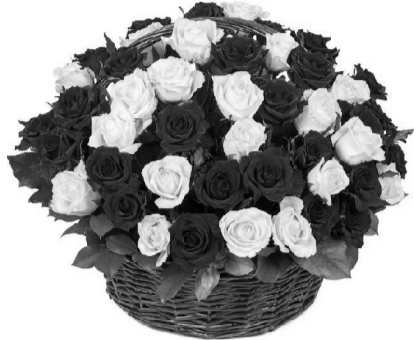
Жена, дети, внуки.

Тебя уважают И ценят друзья И искренне любят Большая семья!